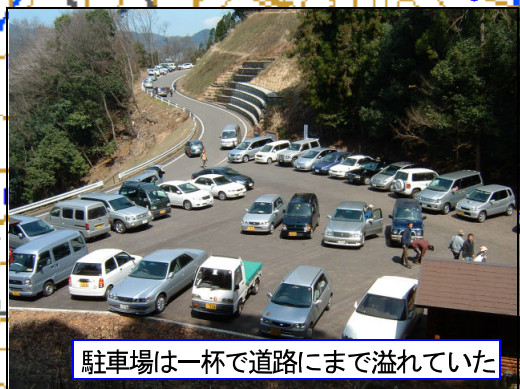
駐車場は一杯で道路にまで溢れていた