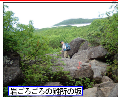
岩ごろごろの難所の坂