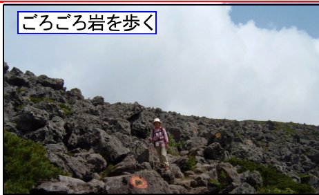
ごろごろ岩を歩く