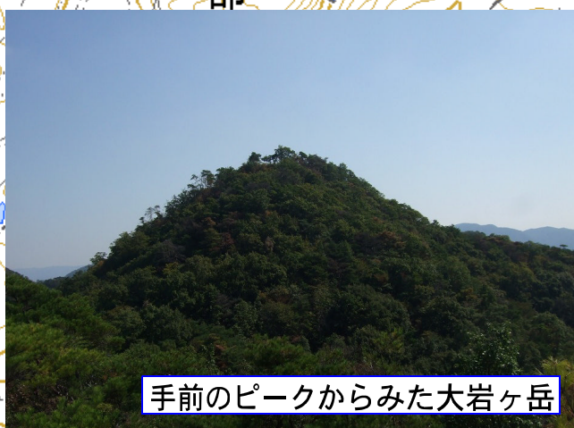
手前のピークからみた大岩ヶ岳